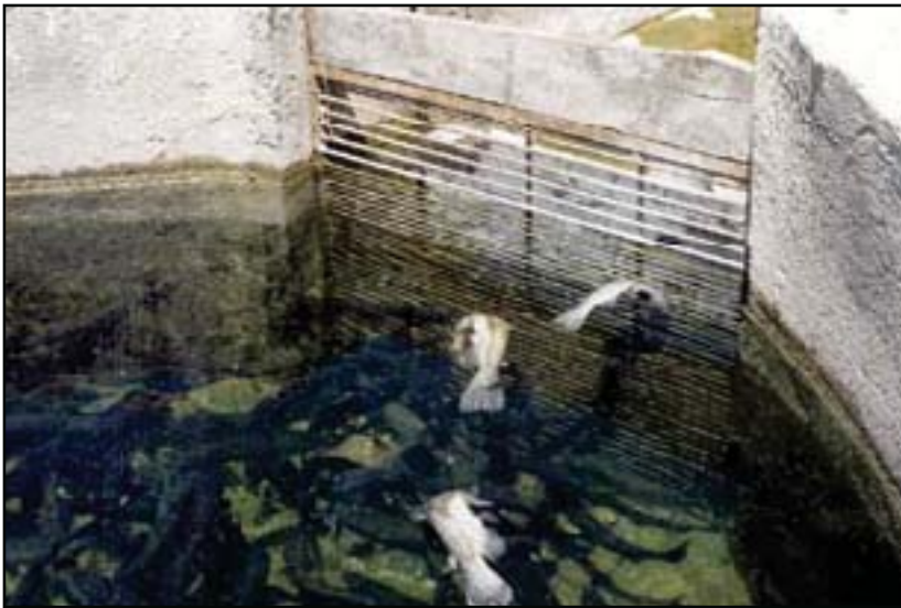
عکس شماره ۳- نمایی از مرگ و میر ماهیان قزل‌آلای رنگین‌کمان در استخر آلوده به بیماری دیپلوستومیازیس