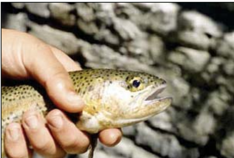
عکس شماره ۴- کاناراکت انگلی چشم‌ماهی قزل‌آلای رنگین‌کمان

بیگ هد) بهترین میزان داروی پرازی کوانتل جهت درمان دیپلوستومیازیس ۱ mg/lit به مدت ۲۴ است به صورت حمام اعلام شد که به نظر می‌رسد این دوز و این مدت زمان درمان (و تماس انگل با دارو) بدون توجه به گونه ماهی مناسب‌ترین دوز جهت درمان بیماری می‌باشد. زکلی و مولنار (۱۹۹۱) نیز نتیجه مشابهی در درمان ماهیان آمور و فیتوفاگ آلوده با دوز درمانی ۱ mg/lit به مدت ۹۰ ساعت به صورت حمام درمانی را گزارش نمودند.